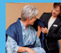
着替え・整容介助